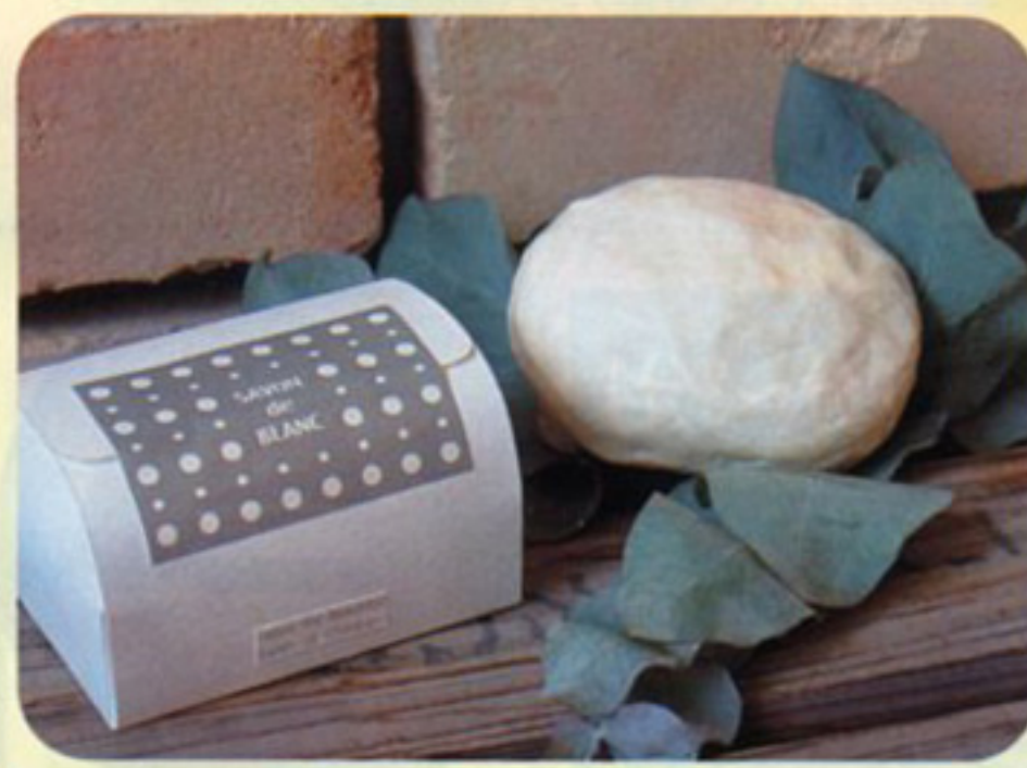
手ごね石けん [サボン・ド・ブラン] 90g